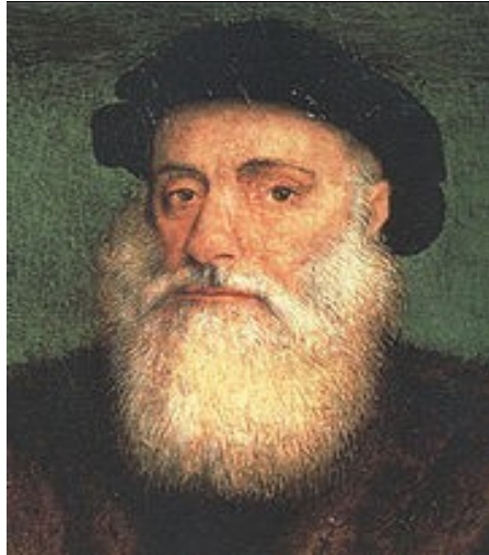
VASCO DE GAMA