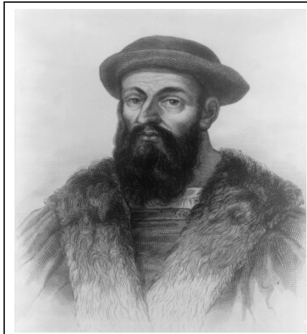
Portrait de Magellan