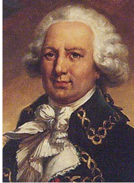
Portrait de Louis Antoine de Bougainville